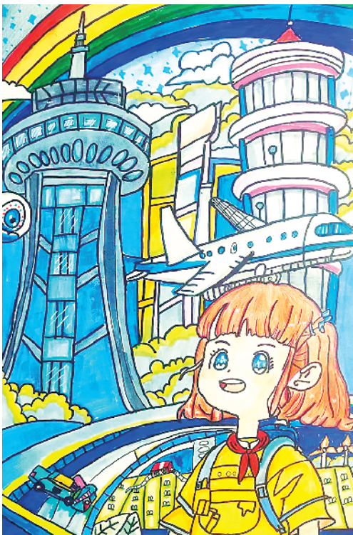
小记者：徐琚玥 周口市六一路小学四(1)班 辅导老师：辛锦