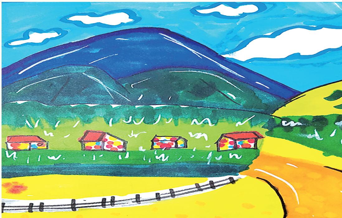
小记者：王诗涵 周口市六一路小学二(10)班 辅导老师：杨慧娟