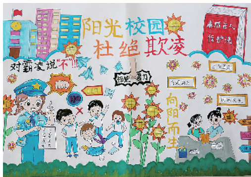
小记者:王瑞鑫 五(4)班 辅导老师:周华磊