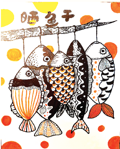
小记者:赵家琦 二(6)班 辅导老师:耿盼